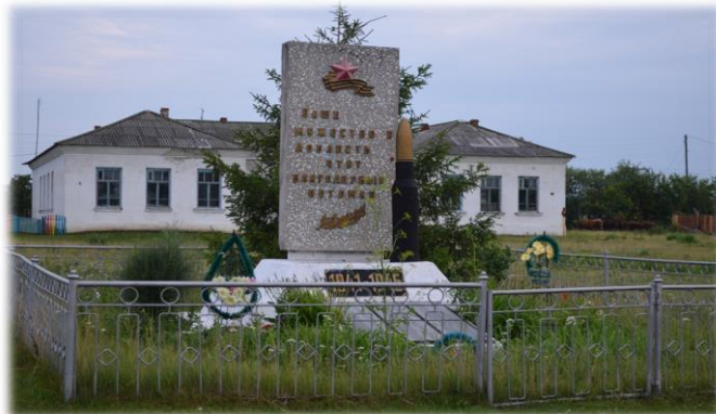
Памятник, в с. Изъедугино